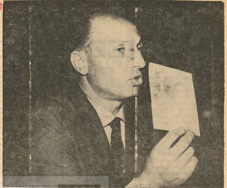
Tabii Senatör Haydar Tunçkanat

Tabii Senatör Haydar Tunçkanat, Senato'da Millî Birlik Grubu adına, Türkiye'mizin yanlış bir savunma stratejisi yüzünden nasıl tehlikeli bir durumda bulunduđunu aydınlatan dikkat çekici bir konuşma yaptı. Bu konuşmanın önemli kısımlarını yayınlıyoruz: